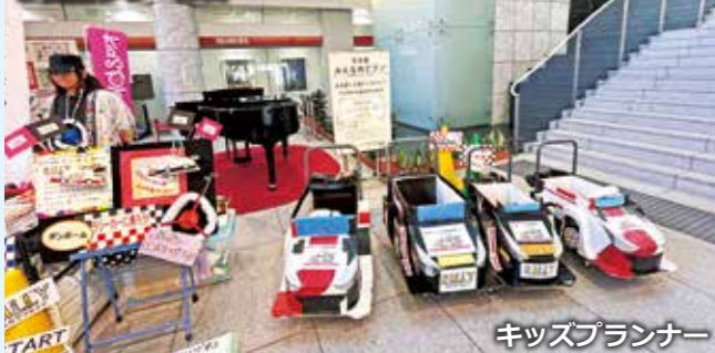
キッズプランナー