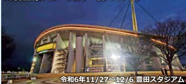
令和6年11/27~12/6 豊田スタジアム