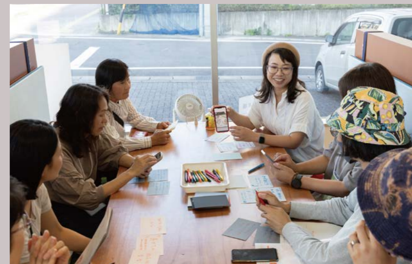
ラーニング専門研修のイメージ