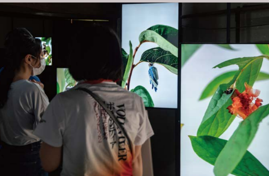
国際芸術祭「あいち2022」ボランティアによるガイドツアー