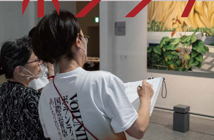
国際芸術祭「あいち2022」筆談ツアー