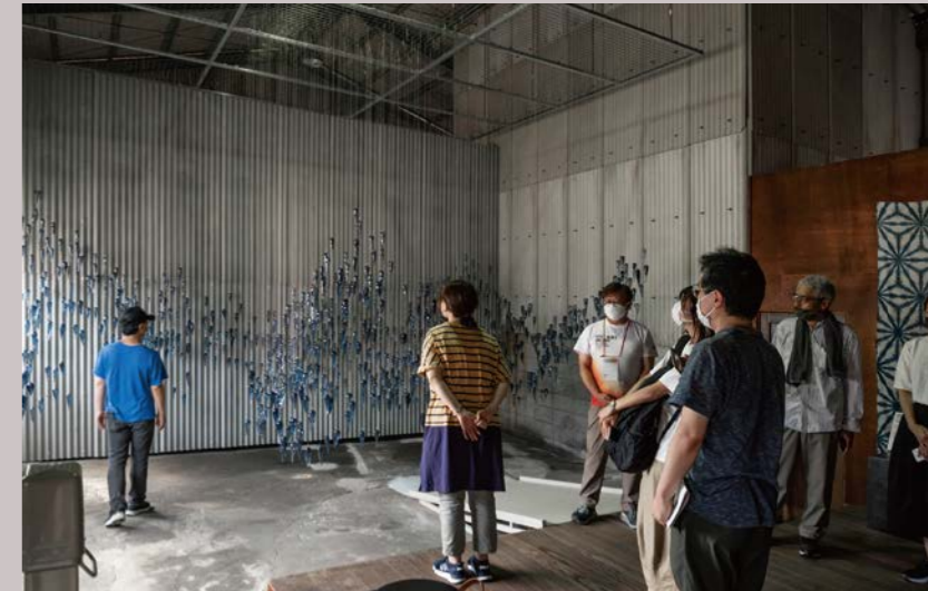
ボランティアによるツアーの様子