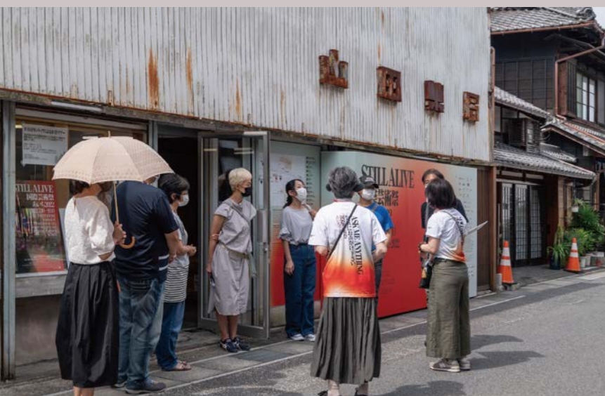
国際芸術祭「あいち2022」ボランティアによるガイドツアー