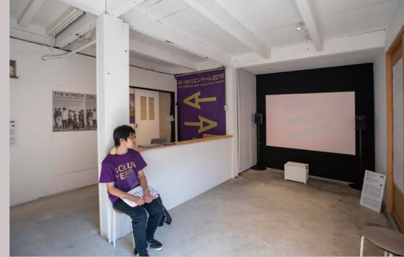
会場運営サポートの様子

[ラーニング専門研修の例] 鑑賞体験をテーマにしたグループの場合、鑑賞とディス カッションをセットにした鑑賞体験プログラム等を受講し、 多様な作品解釈について学びます。