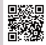
ボランティア募集ページ

※応募受付の完了後、メールで、その旨を順次通知します。 ※上記の方法による申込みができない場合は、 国際芸術祭「あいち2025」ボランティア 事務局までお問い合わせください。